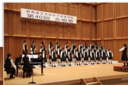
↑ 最優秀賞を受賞した3年5組