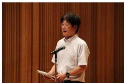
↑ アンパンマンのマーチで会場を盛り上げた校長先生