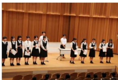
← 賞状とトロフィーを受け取った生徒