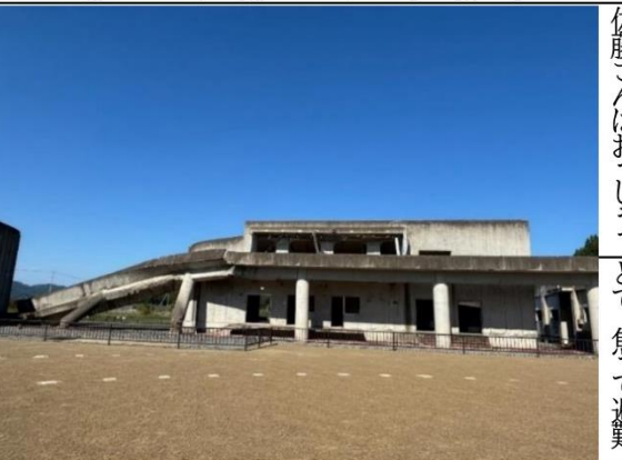
通路が折れた体育館

階の教室は、津波によ ぎるのに最適な山だつ た。また、この釜 り窓が壊れ、大量のた そうだ。しかし、地谷集落では津波が 瓦礫が流れ込んだ。ま 震が起きて津波が到 襲つてきた歴史が た、2階の教室も、す 達しても、先生たち はないため、学校側 べて窓が取れていた。 子どもたちに「山に 逃は震災時の対応や 2階の教室が被害を受 げることには指示し 避難経路を把握し けたことは、襲つた 津つた。何人かの子 どももいていなかった 波の高さと威力を物 たちは、「先生、山に 逃おっしやつてい 語っている。 続いて私たちが目 向かつて走り出した 震が起きて津波が したのは、校舎の2 階うだが、先生はそ れを向かつてくるまで と繋がっていた体育 館止め、校庭に座ら せた50分ほど時間 だ。下の写真を見て わという。他の子ども たちもあつたのに、先生 かる通り、校舎と 体育館にも、ただ校 庭に集方もどう指示 館を繋ぐ通路が折れ、 合させただけで、そ のすれば良いかわか 倒れている。2階の 教室は何も指示を 出さらなかったとい 室と同様、津波には コなかつた。「厳密に いう。そして、どう ンクリートででき た、出せなかつた」と いう津波が来たこ 建物を破壊するほど 佐藤さんはおっしやつ とで、焦つて避難 のエネルギーがあ る ということを証明し ている。こちらも、改 めて津波の恐ろし さ