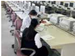
インタビュー・アンケート・フィールドワーク・実験から選んで検証！