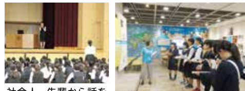
社会人、先輩から話を聞いて理想像を追求！