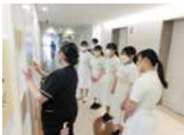
東大キャンパスツアー