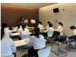
「合格者体験談」その年の卒業生から、受験勉強の極意を聞きます！