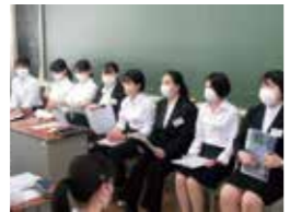
学年別「進路講演会」保護者の方と一緒に、生徒一人一人の進路について考える機会を設けます！