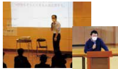
「進路ガイダンス」各学年のスタートに実施。先生が勉強方法をアドバイス！