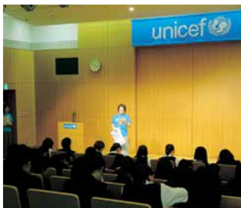
官公庁企業等訪問