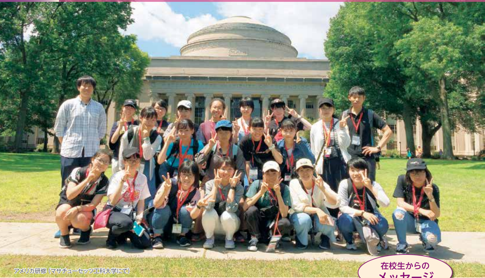
アメリカ研修 (マサチューセッツ工科大学にて)